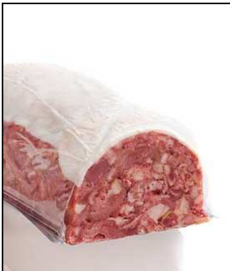
CABEZA DE CERDO IBERICA REF. 2215 UXC: 2 UdM: K