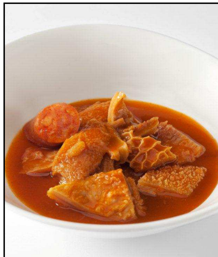
CALLOS DE ½ KG REF. 2216 UXC: 12 UdM: P