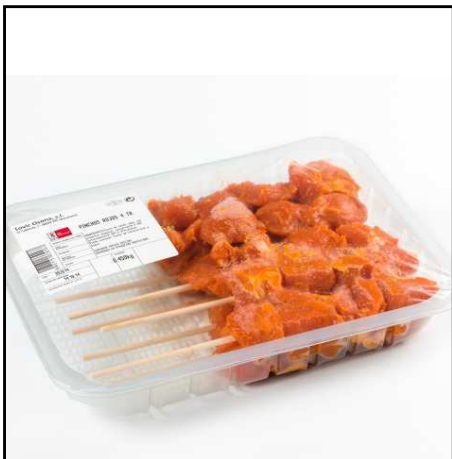
PINCHOS CON PALO 4U BANDEJA REF. 2214 UXC: 6 UdM: P