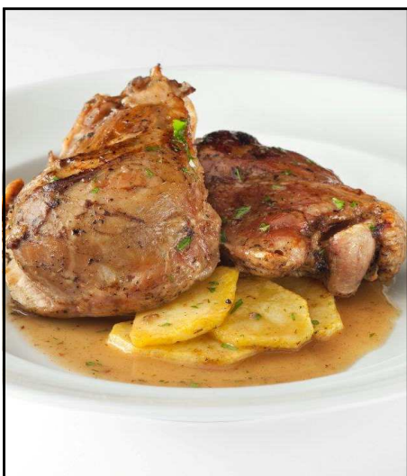
CARRILLERA CERDO 2U 600G REF. 2211 UXC: 6 UdM: P