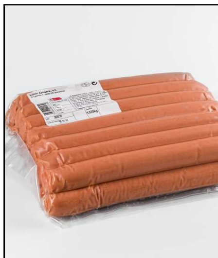
FRANKFURT 1KG APROX REF. 2213 UXC: 1 UdM: K