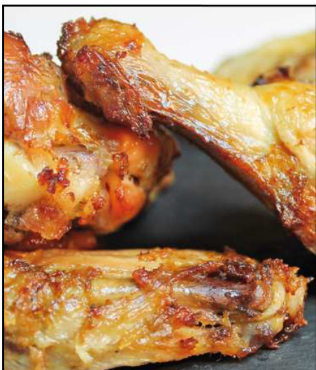
ALITAS 2 RACIONES 200GX2 REF. 2204 UXC: 6 UdM: P