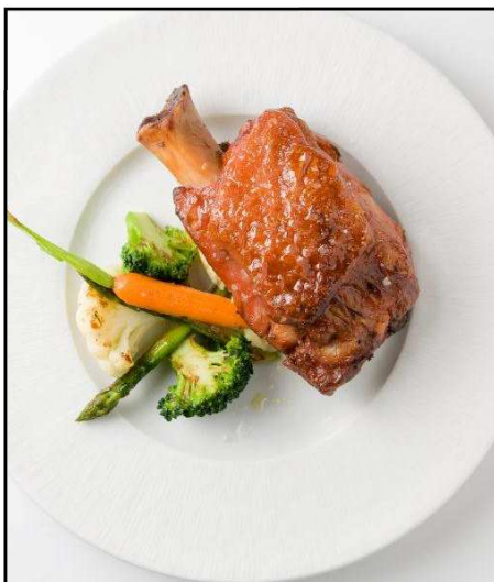
CODILLO ALEMAN ½ COCIDO 600G REF. 2209 UXC: 6 UdM: P