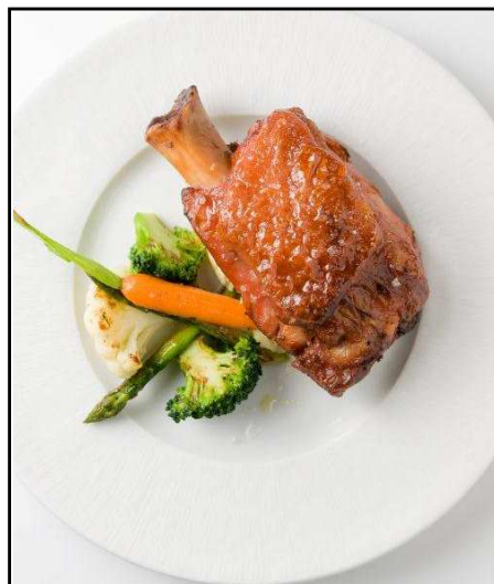
CODILLO ALEMAN ½ ASADO 500G REF. 2210 UXC: 6 UdM: P