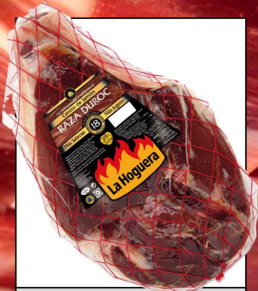
CENTRO JAMON 18M REF. 3024 UXC: 2 UdM: K