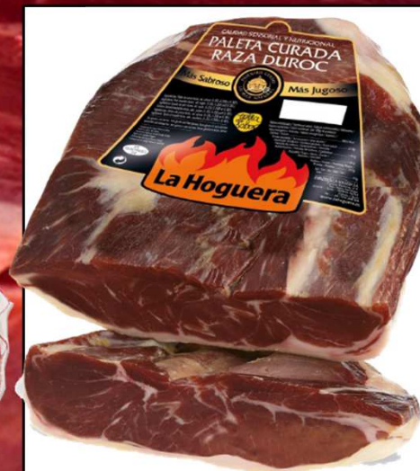
CENTRO PALETA DUROC LIMPIA REF. 3013 UXC: 4 UdM: K