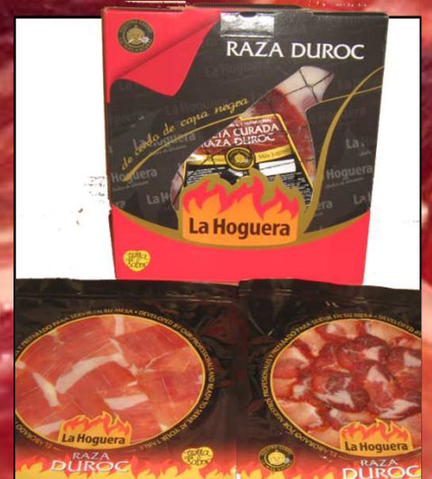
ESTUCHE CENTRO PALETA DUROC REF. 3008 UXC: 1 UdM: P