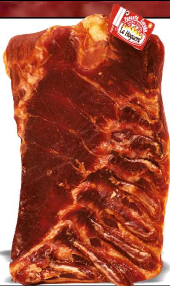
PANCETA ADOBADA REF. 3011 UXC: 6 UdM: K