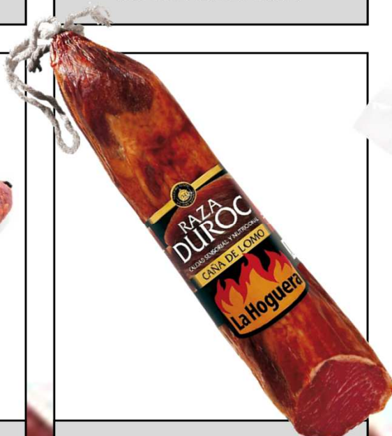
LOMO CURADO DUROC 1/2 REF. 3005 UXC: 6 UdM: K