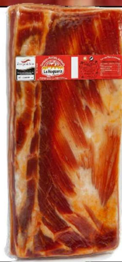
TORREZNO DE SORIA REF. 3019 UXC: 4 UdM: K