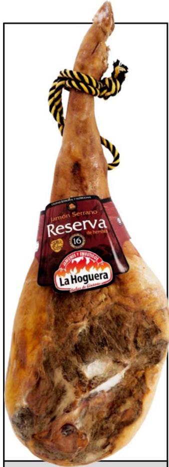
JAMON BODEGA RESERVA 16M HEMBRA REF. 3004 UXC: 1 UdM: K