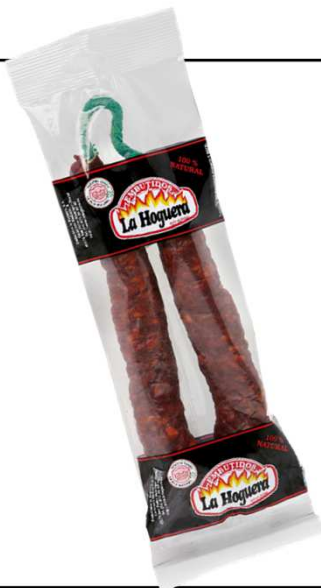
CHORIZO CASERO PICANTE 280G REF. 3002 UXC: 20 UdM: P