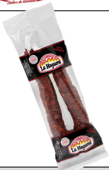
CHORIZO CASERO DULCE 280G REF. 3001 UXC: 20 UdM: P