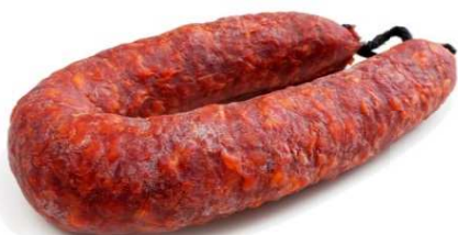
CHORIZO GRANEL PICANTE SARTA REF. 3027 UXC: 20 UdM: K