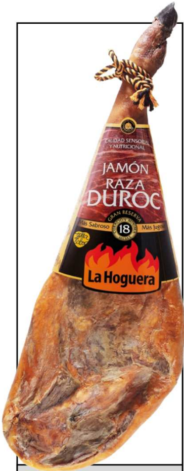
JAMON GRAN RESERVA DUROC REF. 3007 UXC: 1 UdM: K