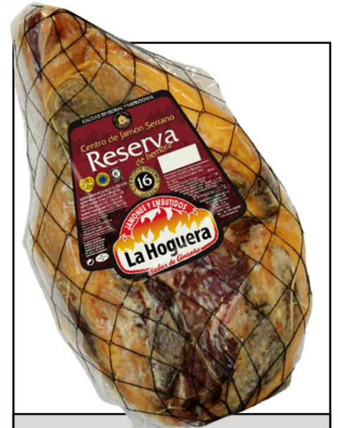
CENTRO JAMON 18M RESERVA HEMBRA REF. 3021 UXC: 2 UdM: K