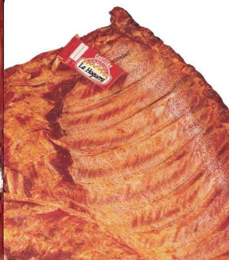
COSTILLA ADOBADA REF. 3010 UXC: 6 UdM: K