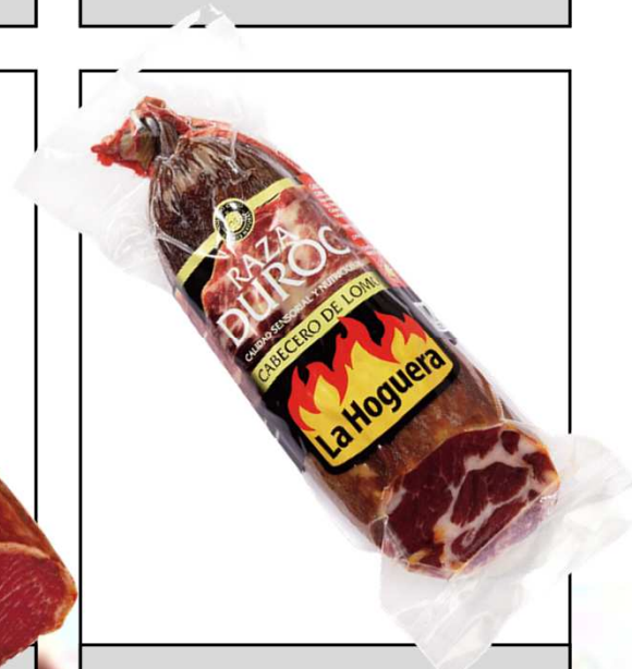
CABECERO DE LOMO DUROC 1/2 REF. 3006 UXC: 6 UdM: K